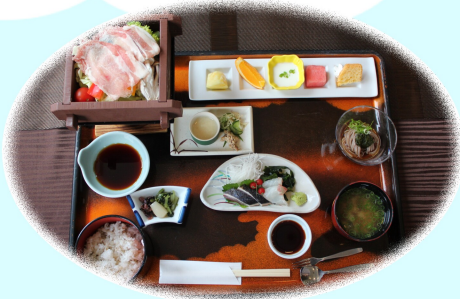
『マールポークと野菜のセイロ蒸し』

三朝温泉病院で人間ドックを受診されると終了後、ブランチールみささで『ヘルシーランチ』がいただけます!