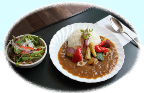
『野菜ゴロゴロカレー』