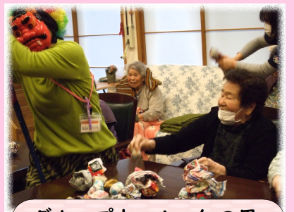
グループホーム 仁の里

2月2日(土)、特養家族会にご協力いただき節分祭を実施しました。今年も豆腐団子入りのぜんざいを、ご利用者や職員へふるまわれ、豆腐団子がやわらかくて食べやすく「おいしい」との声がたくさん聞かれました。