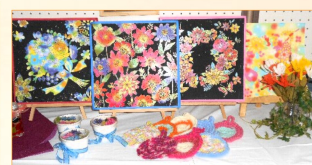
スクラッチアート制作