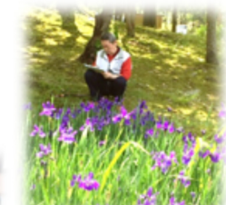
菖蒲園でスケッチ