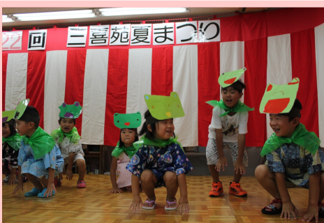
こども達がかわいいカエルになって登場しました♡