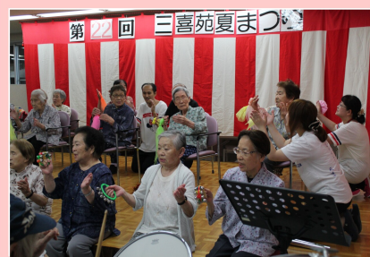
リズムクラブの発表 日頃の成果を発揮しました♪