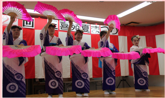
傘・銭太鼓みささ湯の町会様の華麗な踊り