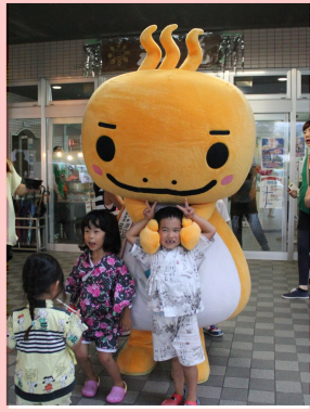
ラドンとのふれあい

今回は傘・銭太鼓みささ湯の町会の皆様の演芸を中心に、賀茂保育園のこども達のかわいい踊りや職員のダンス等で会場は大盛り上がり。玄関ロビーでは「みささラドン」とのじゃんけん大会をはじめ、今年はグループホーム仁の里で収穫された野菜の販売もありました。短い時間ではありましたが、ご利用者の皆さんに夏の夜を楽しんでいただくことが出来たと思います。ボランティア・家族会の皆様、ご協力ありがとうございました。