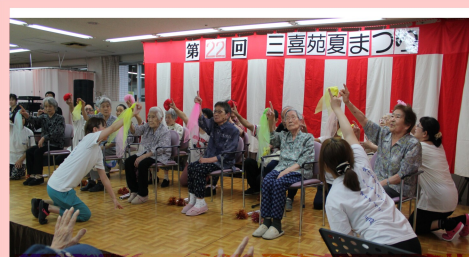
仁の里太鼓を使って 「旅の夜風」を歌いました!