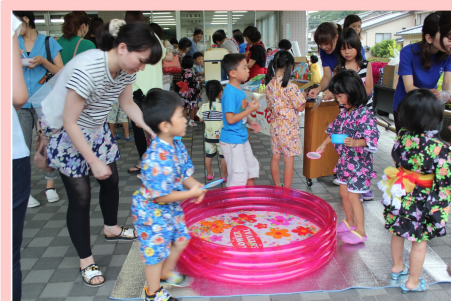
キッズコーナーで金魚すくい。 何匹すくえたかな～(*^_^*)