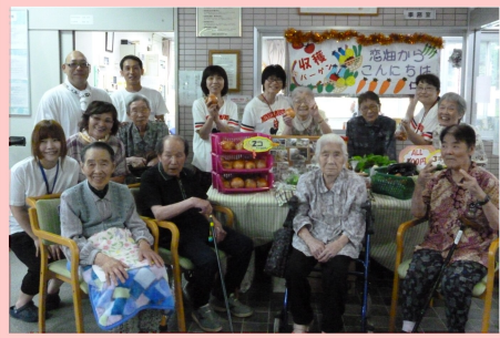
仁の里「恋畑」で収穫した、野菜です。いらっしやい♪