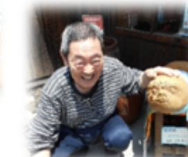
観光気分で白壁土蔵へ