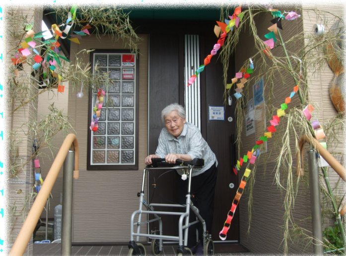
新型コロナウイルスが 終息しますように...