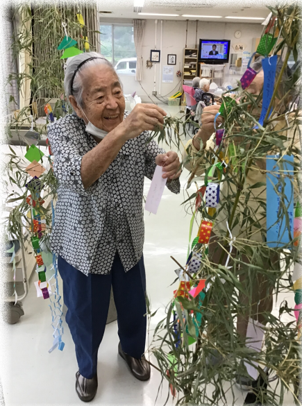
元気でデイサービスに 通えますように