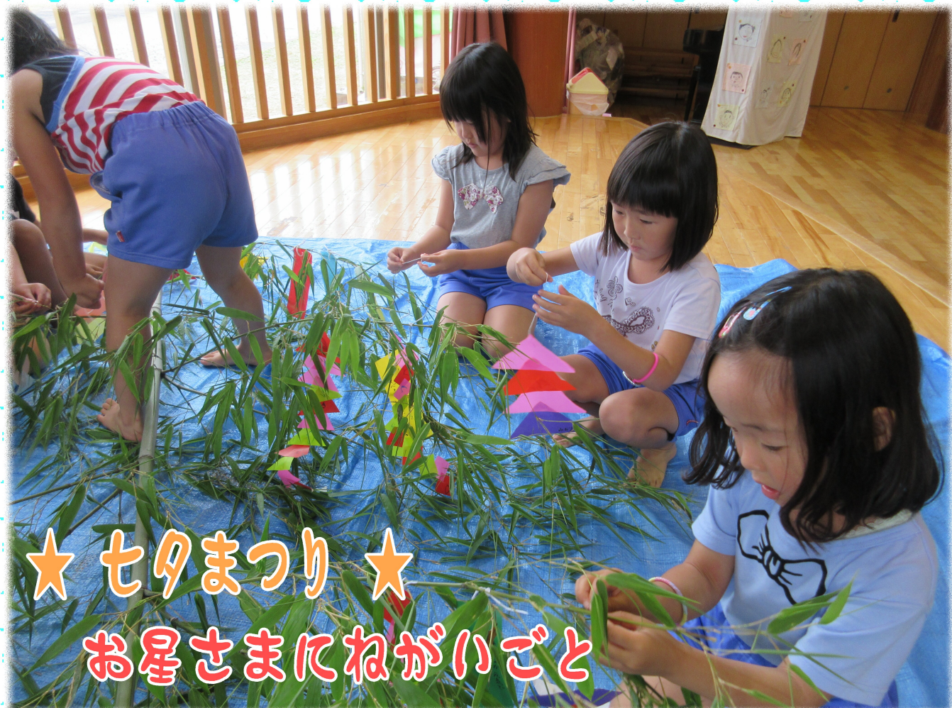
★七夕まつり★ お星さまにねがいごと