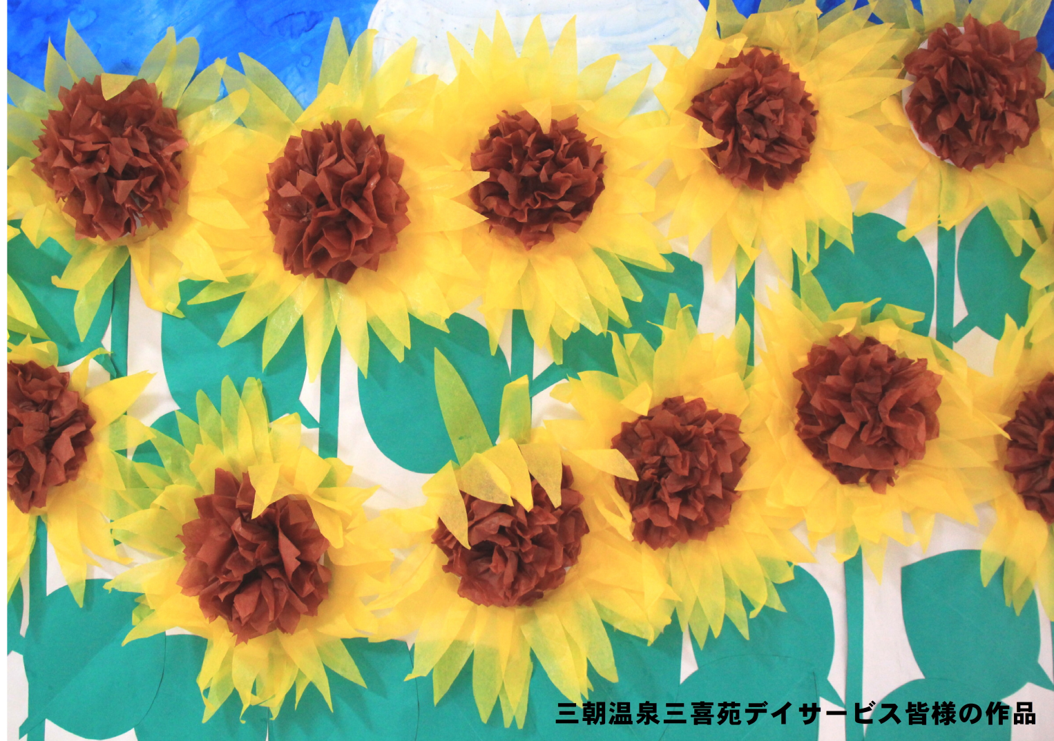
三朝温泉三喜苑デイサービス皆様の作品